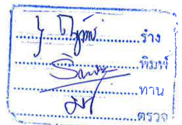
(นายจำเนียร ก้อนธิงาม) นายกเทศมนตรีตำบลนาม่อง

ประกาศ ณ วันที่ ๑๐ เดือนมกราคม พ.ศ. ๒๕๖๘