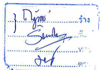
(นายจำเนียร ก้อนธิงาม) นายกเทศมนตรีตำบลนาม่อง

ประกาศ ณ วันที่ ๕, เดือนพฤศจิกายน พ.ศ. ๒๕๖๗