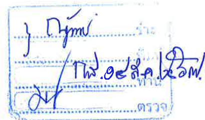
(นายจำเนียร ก้อนธิงาม) นายกเทศมนตรีตำบลนาม่อง

ประกาศ ณ วันที่ ๑๔ เดือนสิงหาคม พ.ศ. ๒๕๖๗