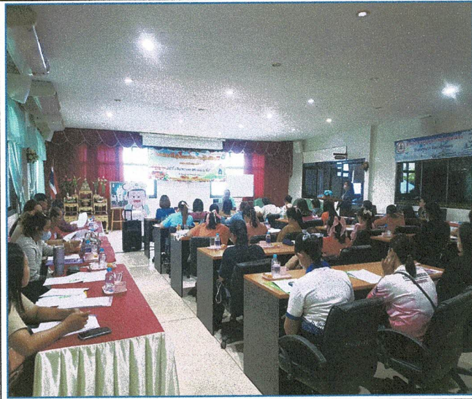
ภาคบรรยาย